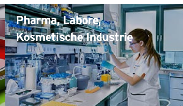
Pharma, Labors, Kosmetische Industrie