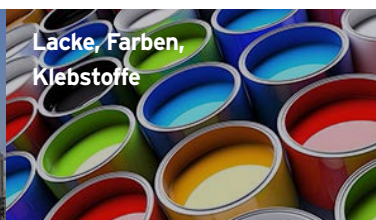
Lacke, Farben, Klebstoffe