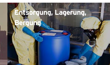
Entsorgung, Lagerung, Bergung