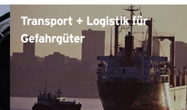
Transport + Logistik für Gefahrgüter