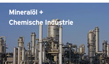
Mineralöl + Chemische Industrie

▶ Ideal für Lagerung, Versand + Transport in allen Branchen. Profitieren Sie von Experten-Beratung durch unsere Gefahrgutbeauftragten